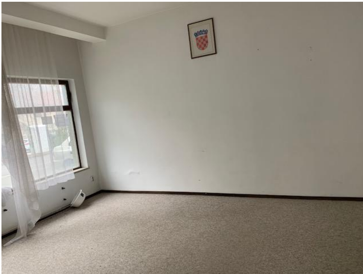
Slika 12. Poslovni prostor