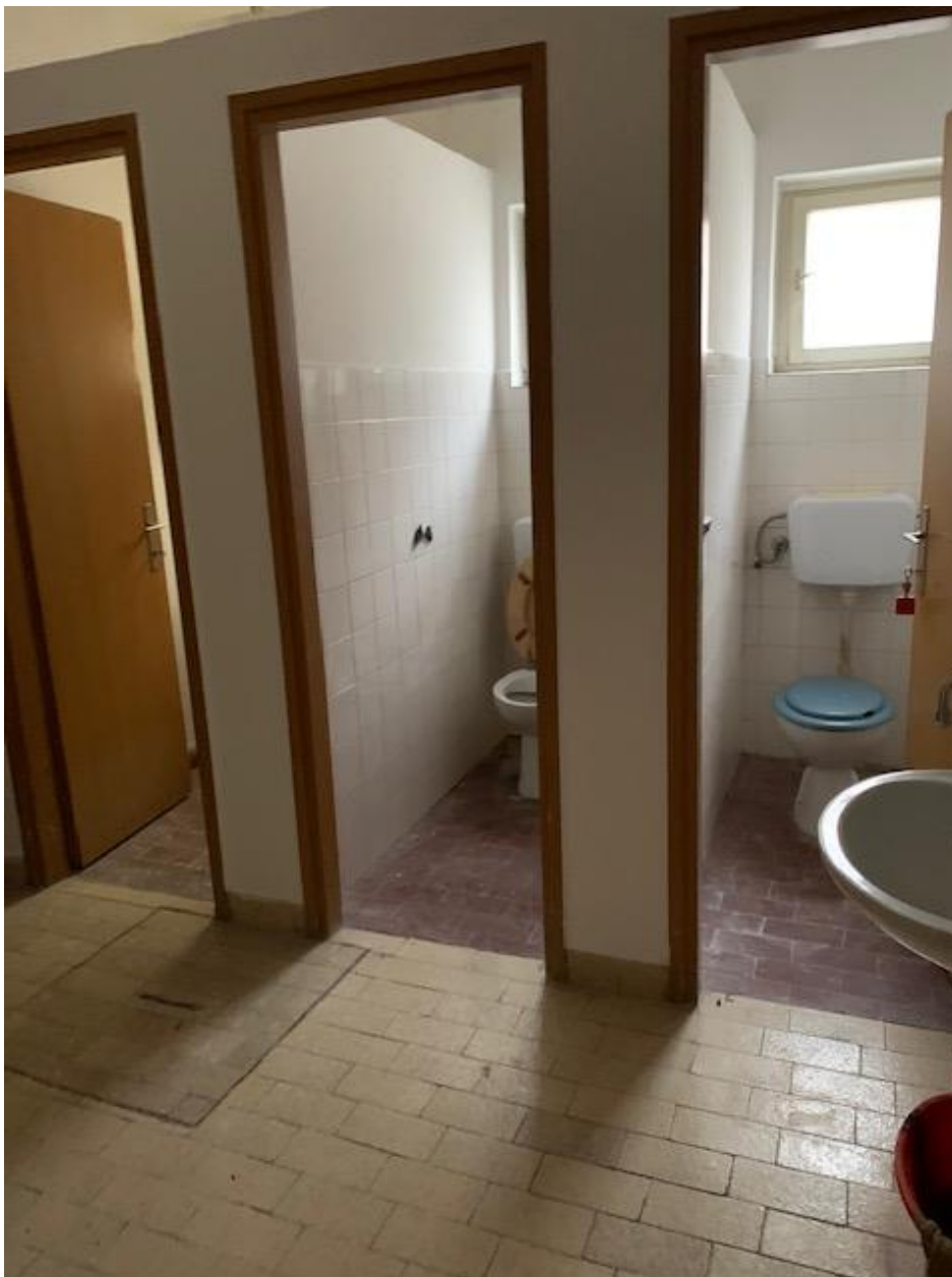
Slika 9. Sanitarni čvor