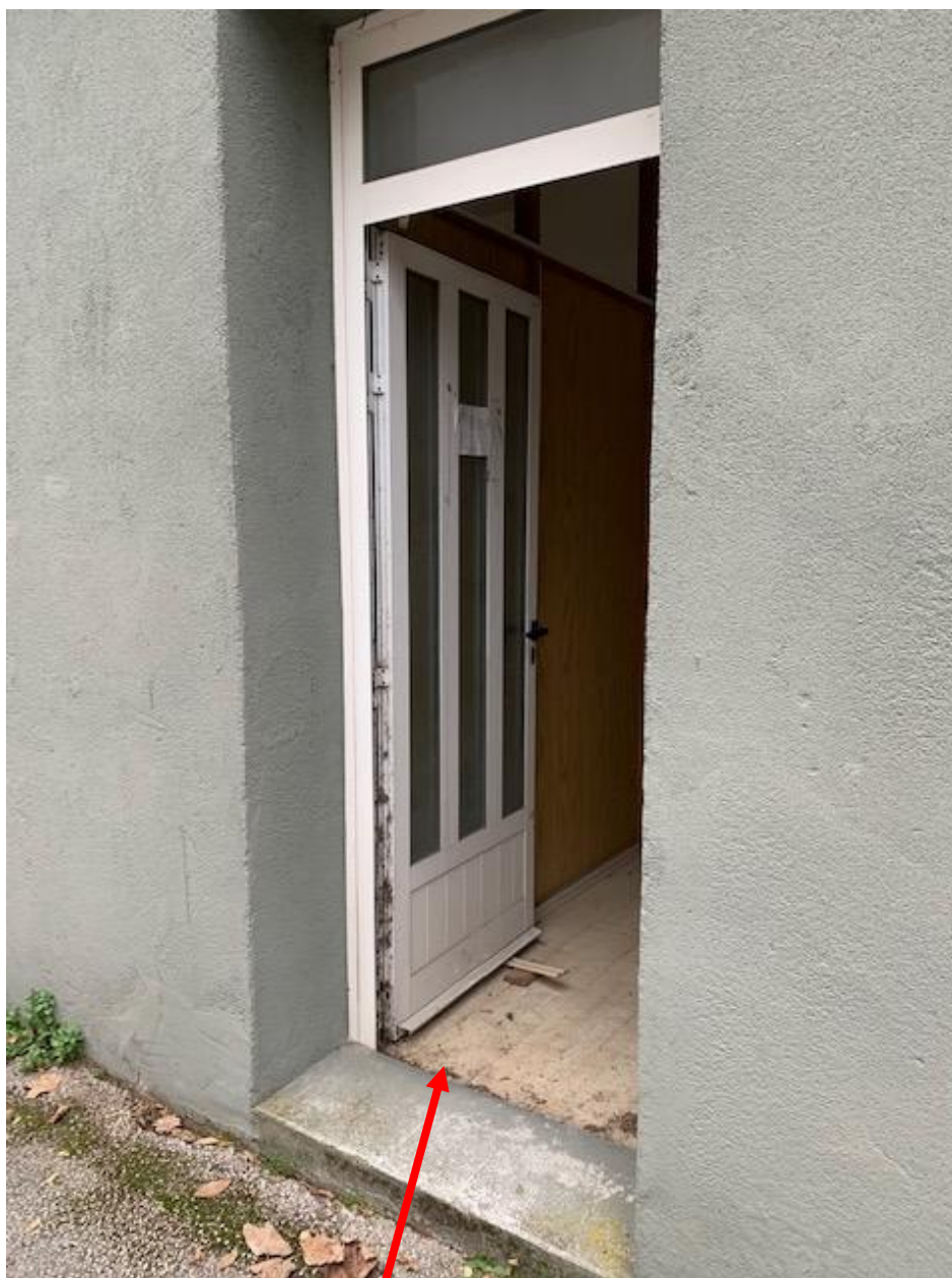
Slika 6. Ulaz u prizemlje