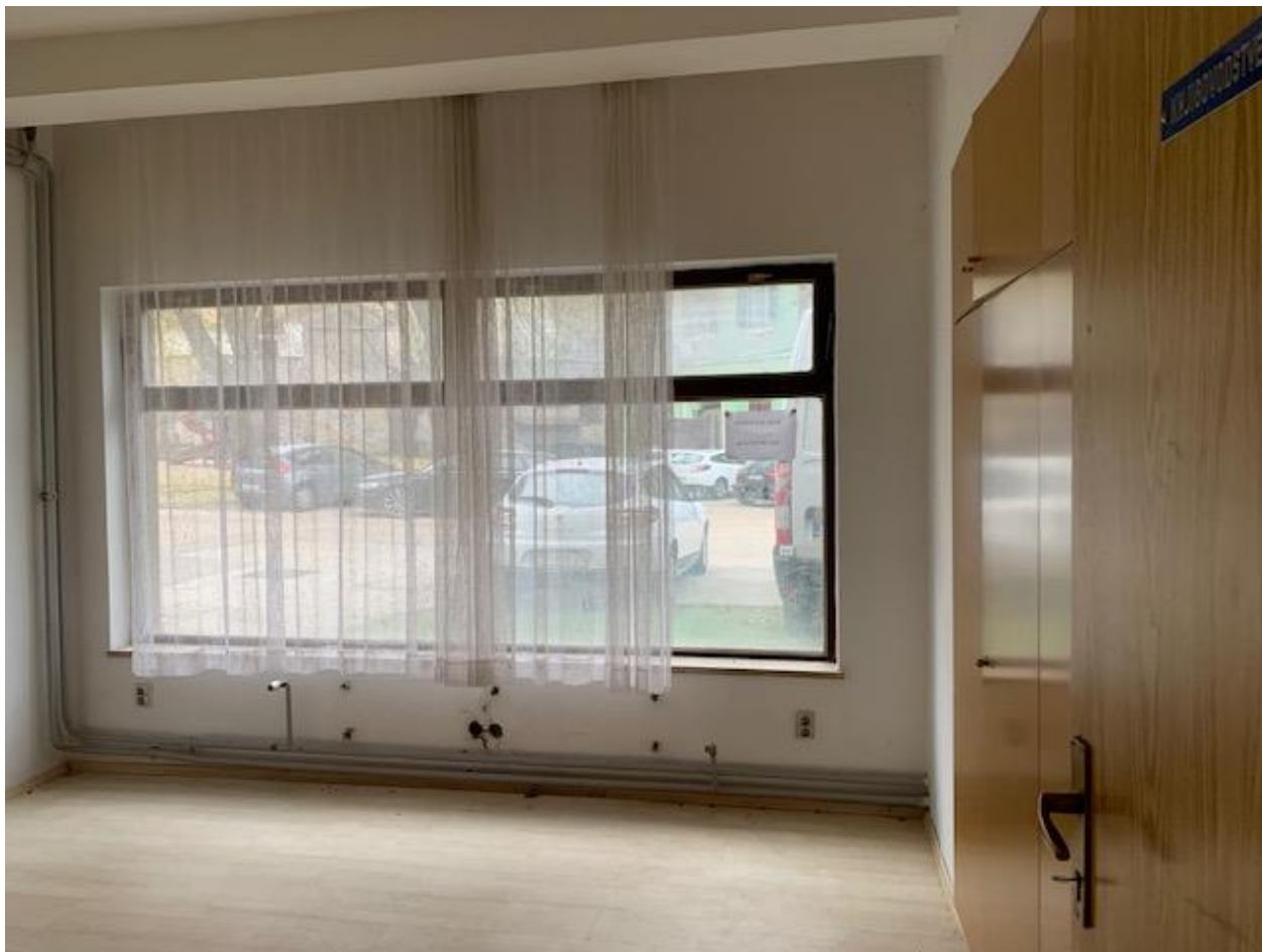
Slika 15. Poslovni prostor