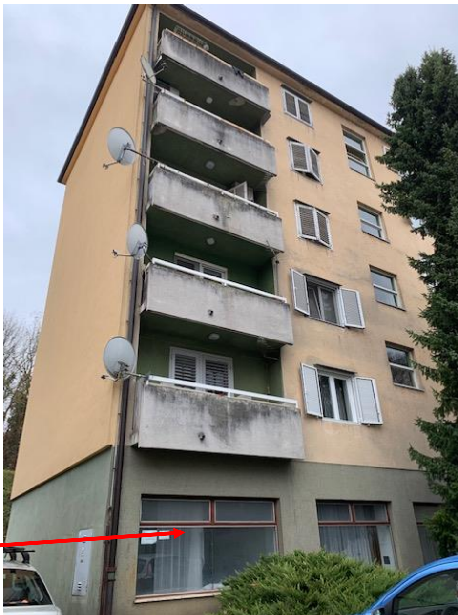
Slika 3. Prizemlje predmetne zgrade na adresi Stari Trg 1A