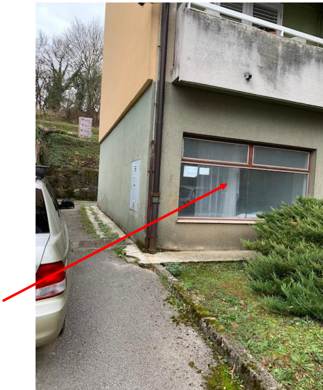
Slika 2. Prizemlje predmetne zgrade na adresi Stari Trg 1A