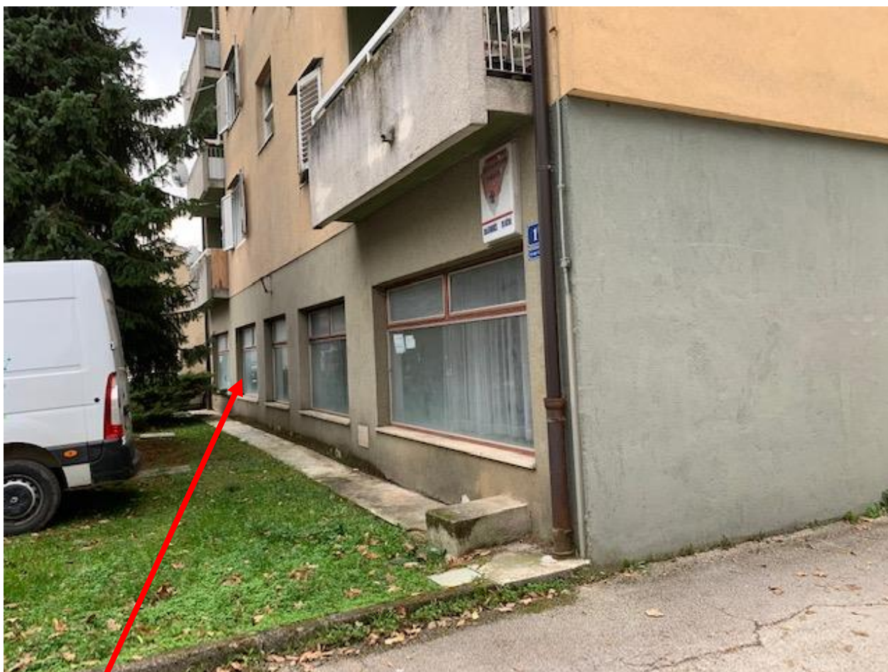
Slika 4. Prizemlje predmetne zgrade na adresi Stari Trg 1A