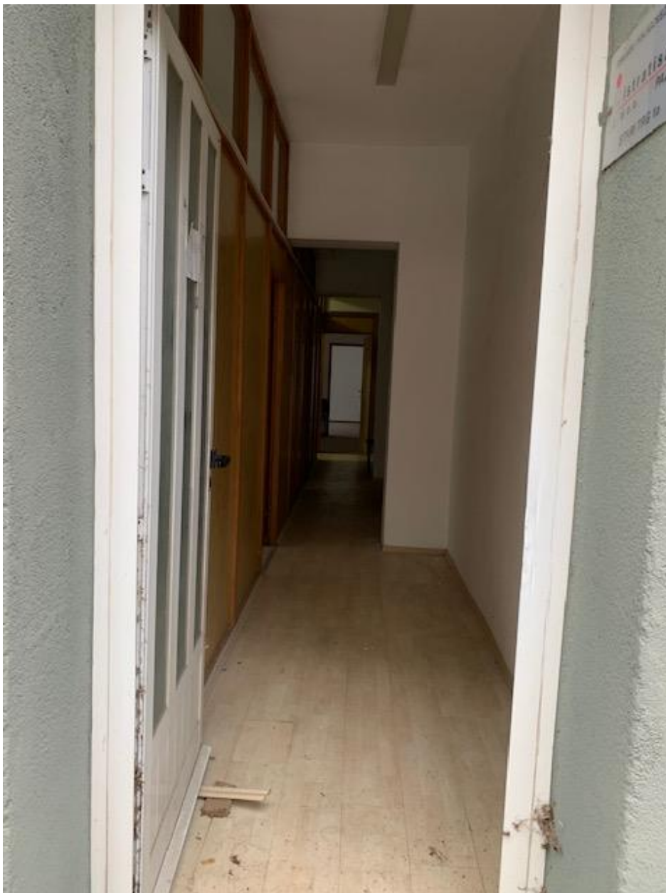
Slika 7. hodnik u prizemlju