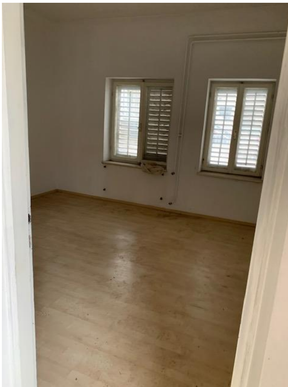
Slika 8. Poslovni prostor