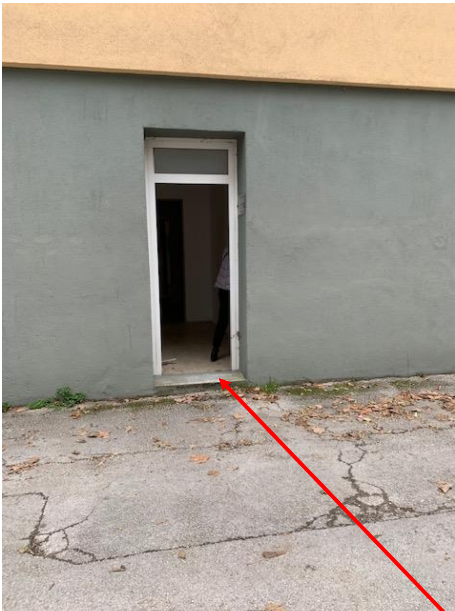
Slika 5. Ulaz u prizemlje predmetne zgrade na adresi Stari Trg 1A