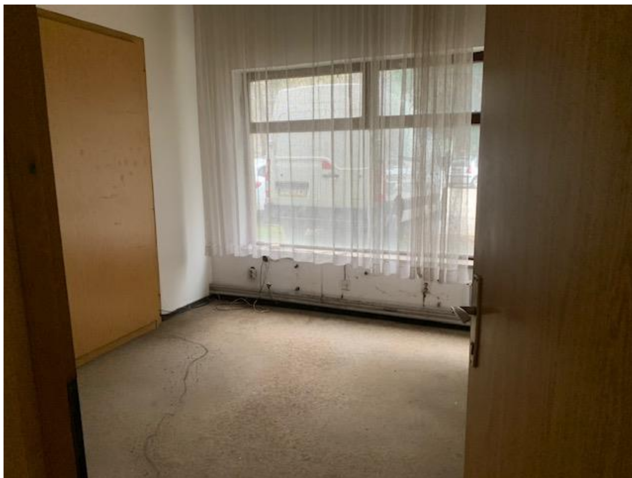
Slika 14. Poslovni prostor