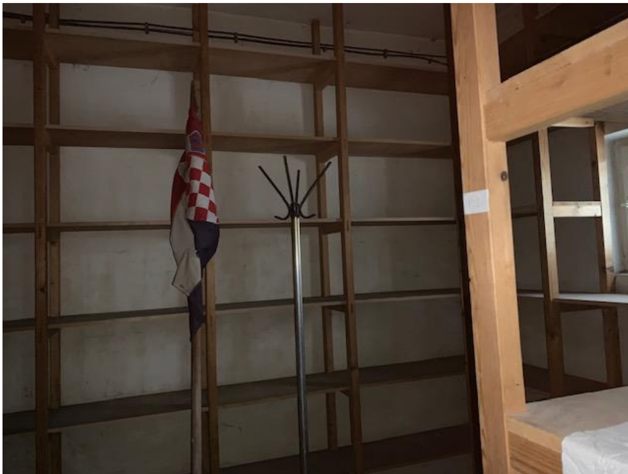
Slika 10. Poslovni prostor