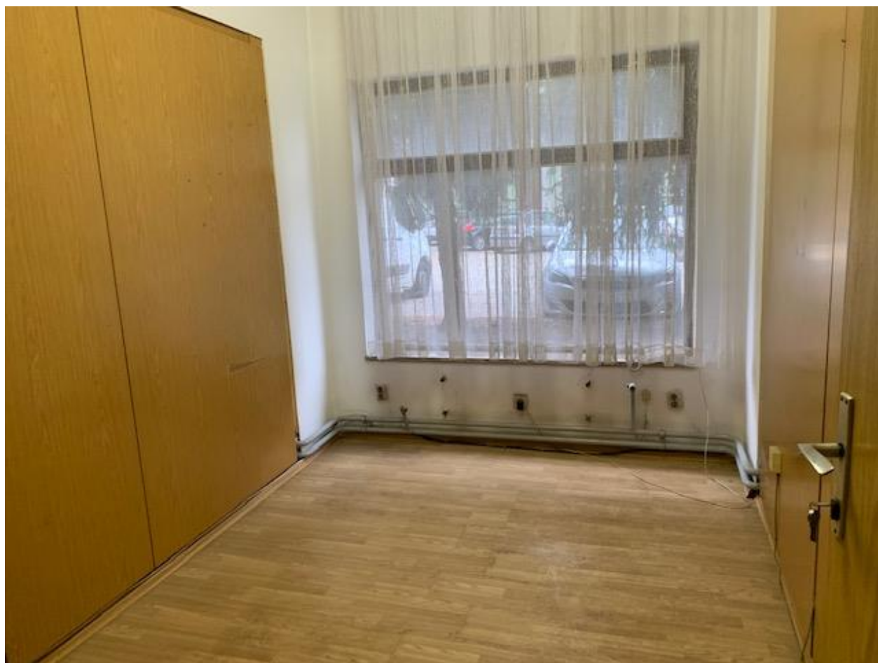
Slika 13. Poslovni prostor